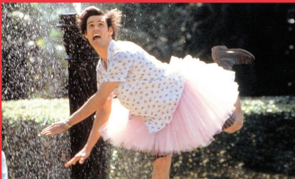
↑ Ace Ventura: Pet Detective de Tom Shadyac (1995)