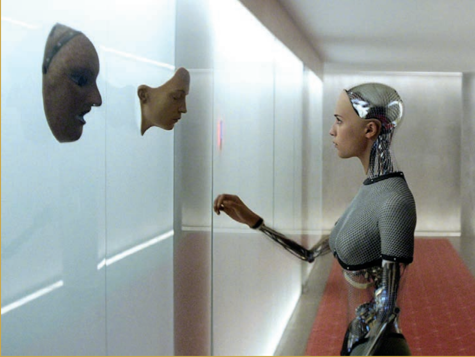
↑ Ex Machina de Alex Garland (2014)