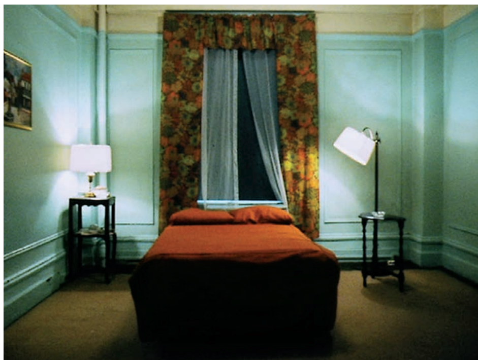
↑ Hotel Monterey (1972)