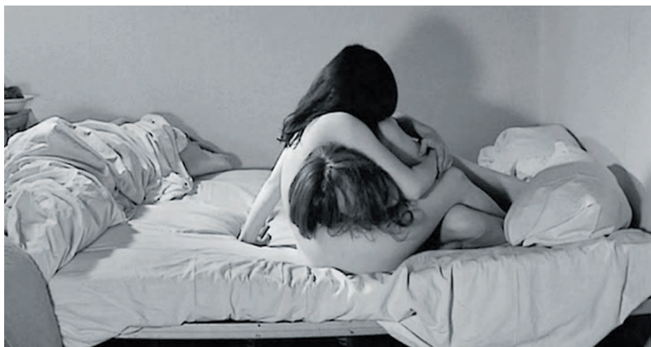
↑ Je, tu, il, elle de Chantal Akerman (1974)