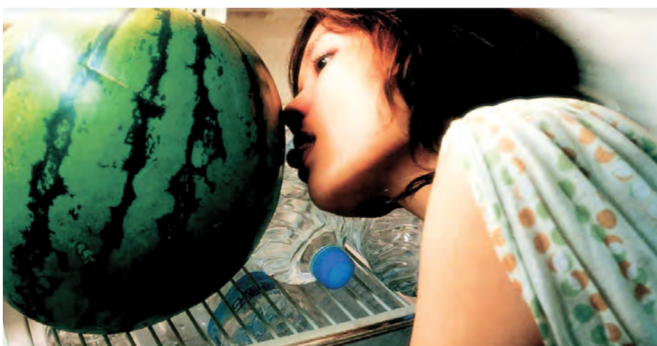
→ La saveur de la pastèque de Tsai Ming-liang (2005) →