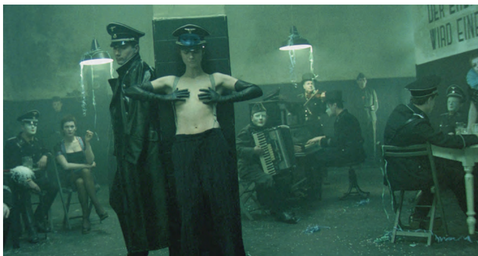
→ Portier de nuit de Liliana Cavani (1974)