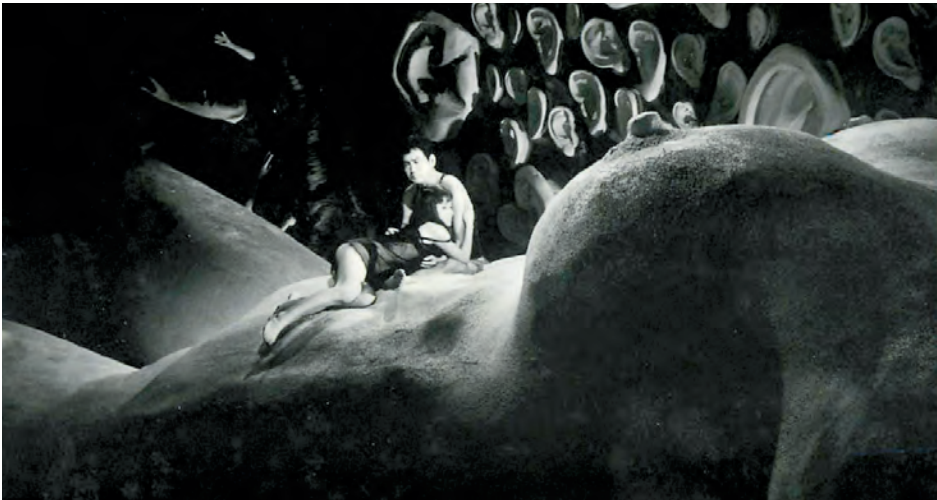
↑ La bête aveugle de Yasuzō Masumura (1969) → Crimes of Passion de Ken Russel (1984) → Monika de Ingmar Bergman (1953)