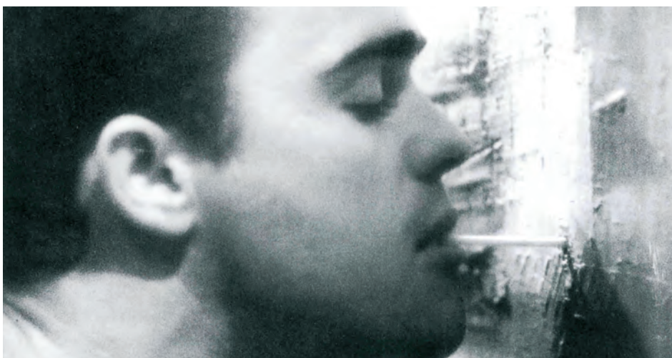
→ Un chant d'amour de Jean Genet (1950)