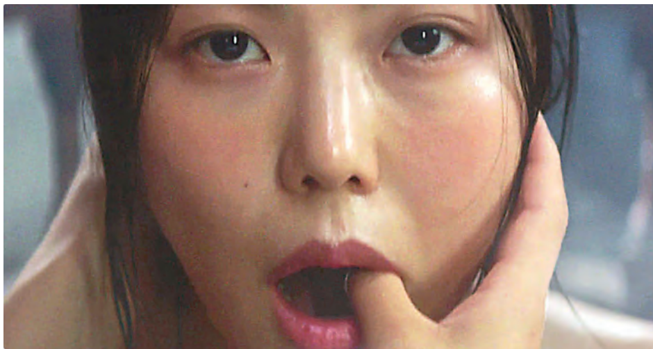
↑ Mademoiselle de Park Chan-wook (2016)