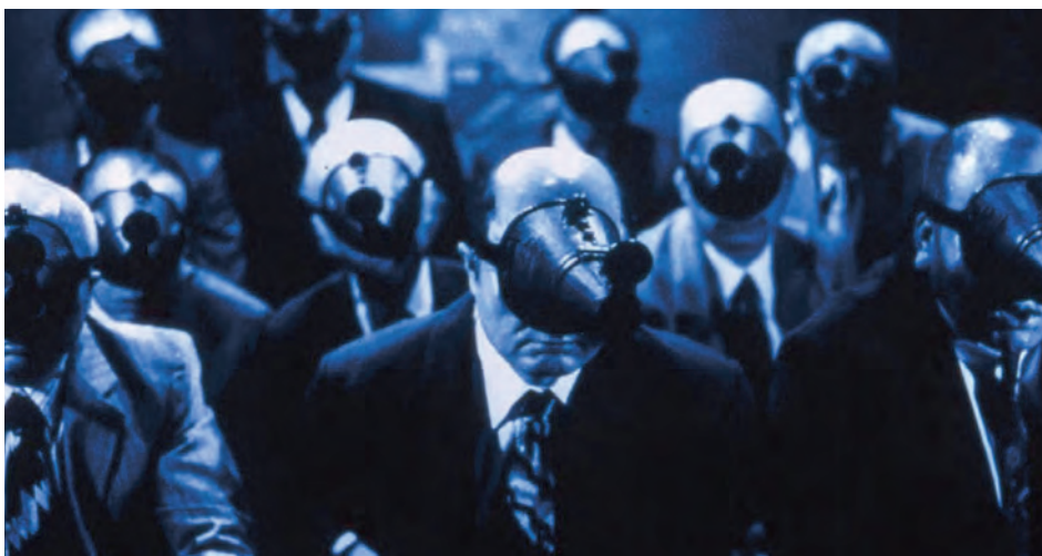
↑ A Snake in June de Shin'ya Tsukamoto (2003) →