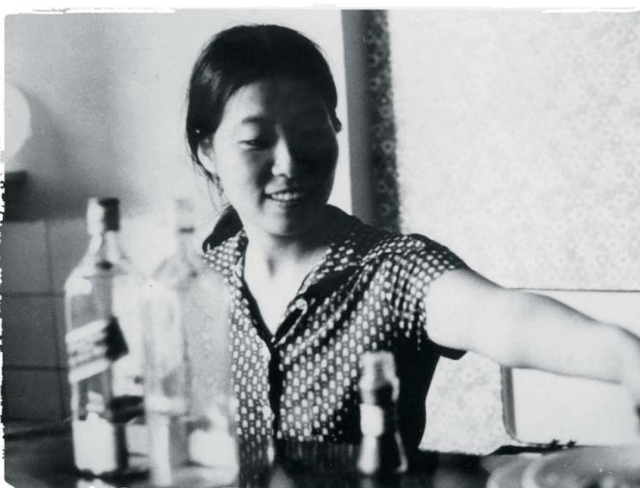
↑ Affiche de Armée Rouge / FPLP: Déclaration de guerre mondiale de Masao Idachi et Kōji Wakamatsu (1971) → Fusako Shigenobu (date inconnue)