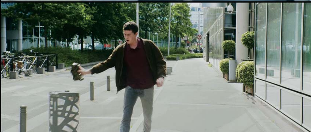
↑ Nocturama (2016)