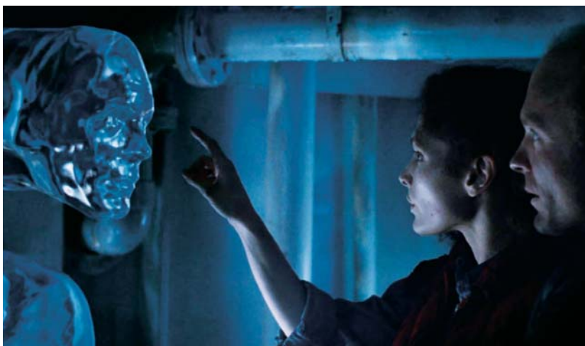
Arrival de Denis Villeneuve (2016) et The Abyss de James Cameron (1989)