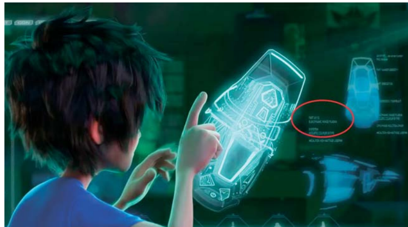
Looker de Michael Crichton (1981), Weird Science de John Hugues (1985) et Big Hero 6 de Chris Williams et Don Hall (2014)