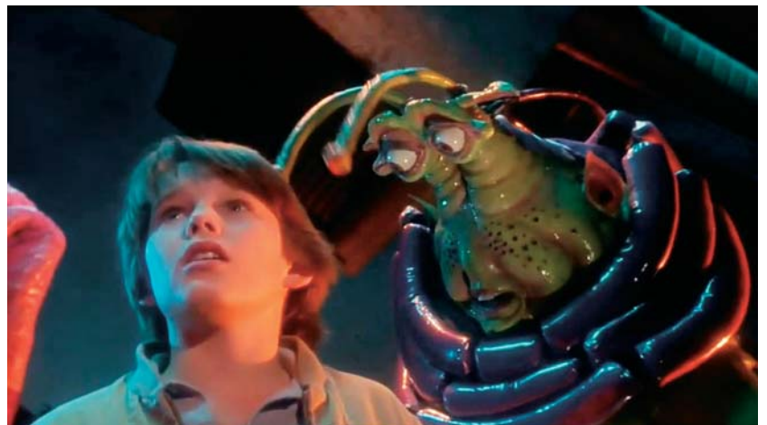
Explorers de Joe Dante (1985)

De 1969 à 1972, « on a marché sur la Lune ». À la fin des années 1970 et surtout dans les années 1980, l'aventure spatiale bat son plein : satellites, sondes ou stations spatiales sont lancés en grand nombre. Les sondes Voyager 1 et Voyager 2 explorent pour la première fois le système solaire, obligeant à reconsidérer tout ce que l'on croyait savoir jusque-là et à réécrire les manuels d'astronomie. Le cinéma témoigne de cet enthousiasme collectif pour les découvertes astronomiques : les sujets dont s'empare la science-fiction témoignent de cet engouement, tout en exploitant ces thématiques de façon ludique et fantastique. Outre les séries de films lucratives comme les Alien , Star Wars et autres Star Trek (initiées au cinéma à la fin des années 1970, développées dans les années 1980), on compte nombre de films « mineurs » mais habités par cette frénésie de l'espace : à titre d'exemples incongrus, le vétéran Stanley Donen s'attelle à la science-fiction avec Saturn 3 (1980), et le célèbre 2001 de Kubrick se voit attribuer une suite, 2010 (Peter Hyams, 1984). D'autres films s'adressent à un public très jeune, comme The Black Hole (« le trou noir », de la compagnie Disney en 1979) ou Explorers (Joe