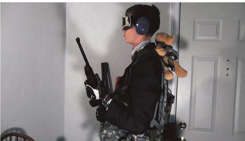
Hoax_Canular (2013) | Pieces And Love All To Hell (2011)