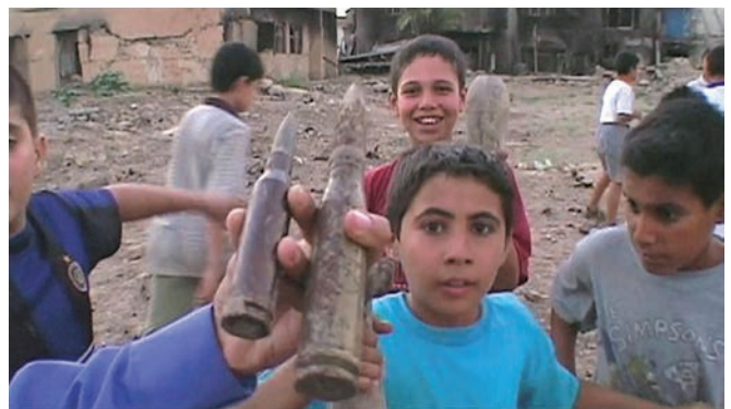
Homeland (Irak année zéro) (2015) Abbas Fadhel