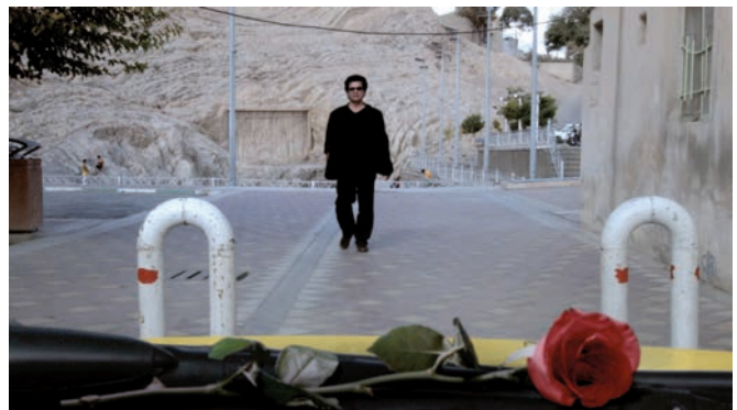
Taxi Téhéran (2015) Jafar Panahi