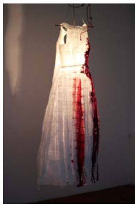
NUPTIAE ALBAS PROJECT

Il y a de courts poèmes inscrits sur 1 100 papiers à cigarette de Damas qu'on ne découvre que si l'on s'en approche, 365 jours sans toi (encre blanche, ruban adhésif, paille, fil de pêche, salive, vidéo). Ils sont suspendus. Une vidéo projette dessus les ombres d'un corps. Rien n'est évident. Les paroles et les formes se révèlent à qui sait