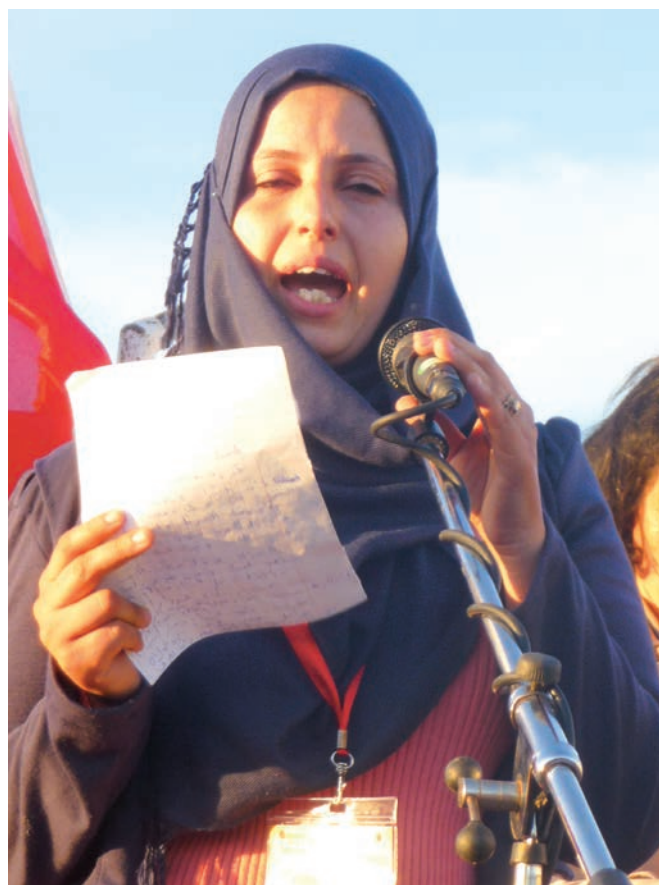
Monastir (Tunisie) : Mère qui déclare que les poissons sont devenus ses ennemis

La veille (7 juin) de l'investiture officielle d'Al-Sissi, je marche dans la rue et entends des cris scandés qui me font penser à une manifestation. Je ne vois aucun attroupement. C'est ma première manifestation fantôme! Des cris sans corps! Soudain, je suis dépassé par un convoi (encadré par des policiers armés) de cinq camions cellulaires avec de tout petits fenestrons grillagés. Je distingue des mains, des nez et des yeux. Je réalise que les cris à l'unisson proviennent de là. Quelques passants (discrètement) font un signe avec les doigts en forme de V, dirigé vers les camions. Ce sont des prisonniers politiques. Je prends une photo à l'aveugle, en feignant de m'intéresser à la vitrine d'une pâtisserie. Effroi.