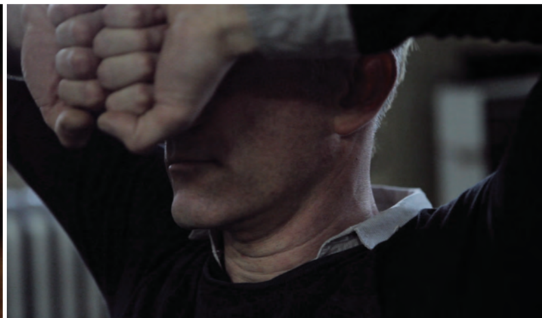
Deux épisodes du collectif ÉPOPÉE