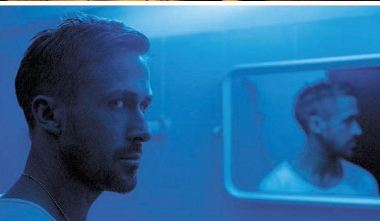
SPRING BREAKERS d'Harmony Korine et ONLY GOD FORGIVES de Nicolas Winding Refn

cas, l'environnement architectural devient le lieu métaphorique d'une exploration de la mémoire, de la subjectivité et des pulsions. C'est un cinéma qui se situe en quelque sorte par-delà le bien et le mal , pour reprendre l'intuition de Nietzsche.