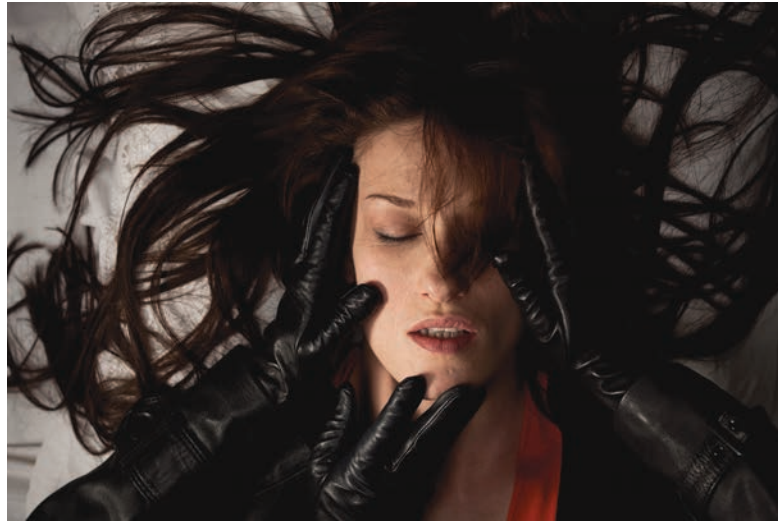
L'ÉTRANGE COULEUR DES LARMES DE TON CORPS , présenté au FNC

De prime abord, L'étrange couleur des larmes de ton corps s'annonçait comme un repli vers un terrain moins aventureux que celui d' Amer . En effet, même si le film se déroule intégralement à