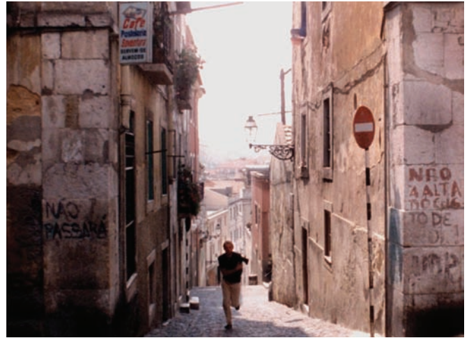
Dans la ville blanche (1983) d'Alain Tanner

s'exprime dans le discours désabusé de son cinéaste de fiction, Diogène du septième art réfugié dans une épave de petite voiture échouée au bas d'une barre d'immeubles déshérités. Les sentences définitives qu'il profère dans une salle de cinéma désaffectée, à propos des images aujourd'hui incapables de montrer ou de dire, sur le sentiment qui l'a saisi que plus il filmait Lisbonne, plus il sentait disparaître cette ville qu'il aime, sa tentative dérisoire d'y répondre par des plans enregistrés à l'aveugle, sont assez promptement battues en brèche par le bon sens de l'ingénieur du son. Oui, il est encore possible de renouer avec l'enfance de l'art, de rejouer à l'homme à la caméra sous le signe bienveillant de Dziga Vertov. Lisbonne Story s'achève sur ce happy end.