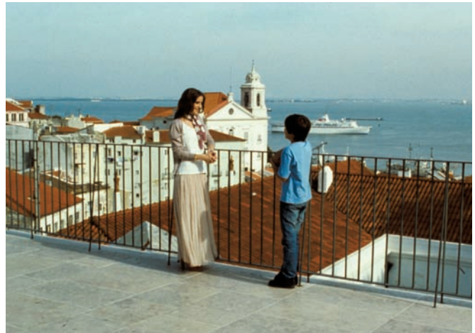
La religieuse portugaise (2009) d'Eugène Green

La beauté particulière de cette ville aux sept collines a fait le reste et chacun de ces films, séparés d'environ une dizaine d'années, en recompose la topographie à sa façon même si, de l'un à l'autre, on en retrouve des signes distinctifs : le majestueux pont qui enjambe le Tage, autrefois nommé Salazar, baptisé Pont du 25-avril après la révolution des Œillets en 1974 ; les vieux tramways jaunes à l'assaut des rues étroites et pentues ; les fameux azulejos ; quelques airs de fado. Un point de vue superficiellement sociologique pourrait avancer qu'entre Dans la ville blanche ,