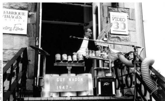
Le roi du drum (1992) de Serge Giguère