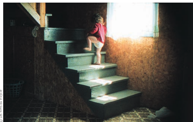
Avant le jour (1999) de Lucie Lambert