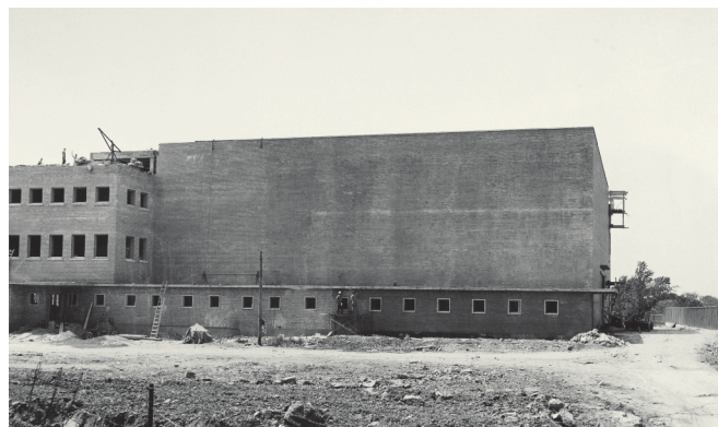
Construction de l'édifice de l'Office national du film à Montréal (1955)