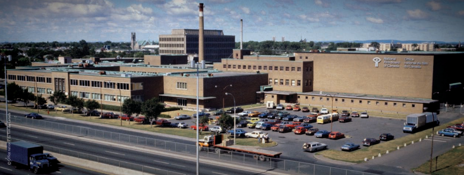
L'édifice de l'Office national du film du Canada à Montréal en 1979

La première chose qu'il faut rappeler avant de se pencher sur la façon dont les institutions en général, et l'ONF en particulier, soutiennent les créateurs, c'est que le cinéma, comme tous les autres arts, existe au Québec et au Canada grâce à un système d'aide et de subventions. Chacun sait que dans un pays aussi peu peuplé que le nôtre, aucune pratique artistique ne pourrait croître et demeurer vivante – c'est-à-dire en étant autre chose qu'un divertissement de masse – sans le soutien de l'État. Celui-ci doit définir des critères et des règles répondant à certaines visées qu'on suppose élevées. Ces visées devraient donc correspondre à un idéal de société où, grâce au partage du bien commun, chacun pourrait avoir une vie meilleure à tous points de vue. On s'imagine ainsi que toute société soucieuse d'offrir à ses membres ce qui est nécessaire à leur épanouissement individuel et collectif veillera à ce que la culture puisse s'y développer pleinement. Mais nos institutions culturelles semblent plutôt victimes d'une sorte d'indécision, qui n'est que le reflet d'une société dont les idéaux sur lesquels elle se fonde apparaissent de plus en plus vagues, au point que celles-ci se trouvent coincées entre leur rôle fondamental (veiller au rayonnement d'une culture florissante) et les impératifs économiques qui tirent tout vers eux.