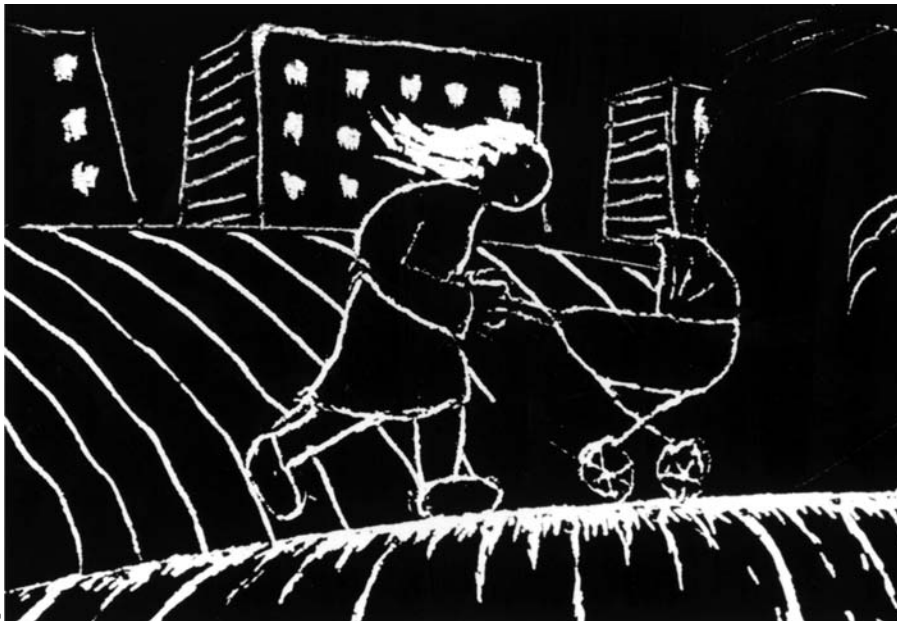
Souvenirs de guerre (1982) de Pierre Hébert

générations passées et traversé les décennies ou les siècles ont toujours été peu nombreux, constituant à chaque époque une poignée d'esprits indomptables. Mais le fait qu'aujourd'hui l'institutionnalisation de l'art ait pour conséquence que la très grande majorité des artistes se trouvent pris en charge par un État au service de cette culture de masse rend néanmoins la situation plus fragile que jamais.