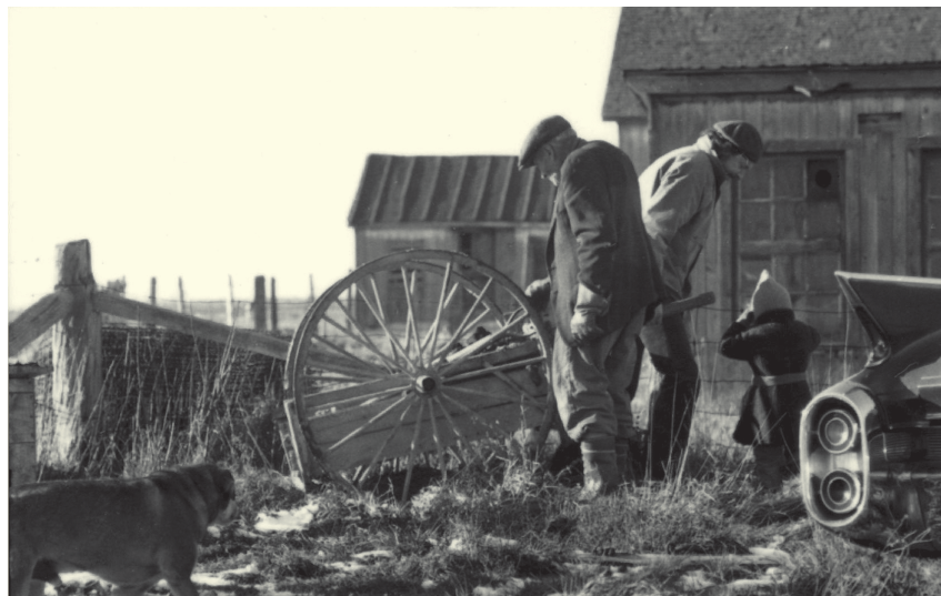
24 heures ou plus... (1973) de Gilles Groulx

Or si aujourd’hui l’ONF est souvent remis en cause, c’est en bonne partie parce qu’il n’a pas su préserver la dynamique créatrice au sein de l’organisme, dynamique qui avait fait de lui un modèle de synergie entre des artistes et une administration et contribué pendant de nombreuses années à sa légendaire vitalité. Ce qu’on voit aujourd’hui du fonctionnement du Programme français de l’ONF, autrefois haut lieu d’effervescence créatrice, c’est que ce rapport de tension est rendu improbable par une manière de garder les artistes dans une position de fragilité (sinon carrément à distance) de sorte qu’aucun bras de fer ne peut s’engager, aucune bravade ou geste de résistance ne peut être tenté sans risquer de compromettre une future « collaboration » avec l’institution. Alors que la disparition des postes de cinéastes permanents a été motivée à l’origine par une raison économique (l’importante réduction du budget de l’ONF), cela a dans les faits permis d’étendre outre mesure le pouvoir détenu par la direction du programme – et d’autant plus depuis la disparition du « comité du programme », remplacé par un comité auquel ne siège aucun créateur (pas même le réalisateur du projet évalué!). Ces bouleversements internes ont ainsi laissé libre cours à une crainte diffuse face aux cinéastes : trop exigeants, trop compliqués, trop fortes têtes. L’emploi pour deux ans de deux cinéastes en