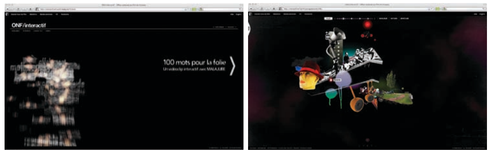
100 mots pour la folie, Écologie sonore

Ce qui se dégage de ces premières tentatives de l'ONF d'investir les nouvelles plateformes de production, c'est à peu près le même mal que celui qui affecte plus généralement le Programme français de l'ONF : aussi longtemps qu'une peur des artistes, des cinéastes, des visions fortes et de l'exploration véritable, de la déroute et du hors norme maintiendront les approches formelles du côté du confort et du consensus, rien ne garantira l'avenir et le rayonnement de cette institution – et ce n'est pas un film qui, de temps à autre, contredit ce fait, ni la vitalité du studio d'animation, qui pourront à eux seuls contrer cette impression générale. Ce que le studio français de l'ONF doit retrouver, c'est une âme et elle ne pourra la reconquérir sans cette fameuse « masse critique » de créa-