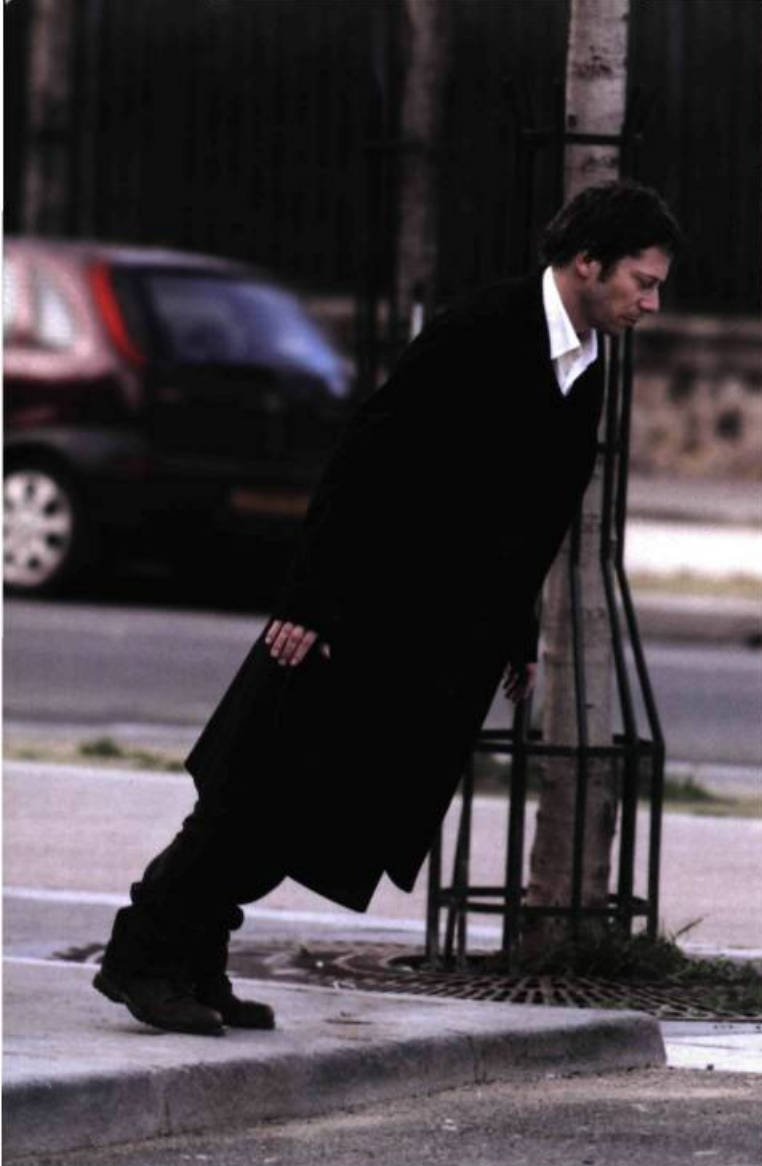
Mathieu Amalric dans Un conte de Noël

Dans Un conte de Noël, il est autant question de science médicale que de relations familiales. On pense à Rois et reine, mais aussi à La sentinelle et au thème de la bâtardise qui revient de film en film chez vous. Comment l'idée de ce scénario vous est-elle venue ?