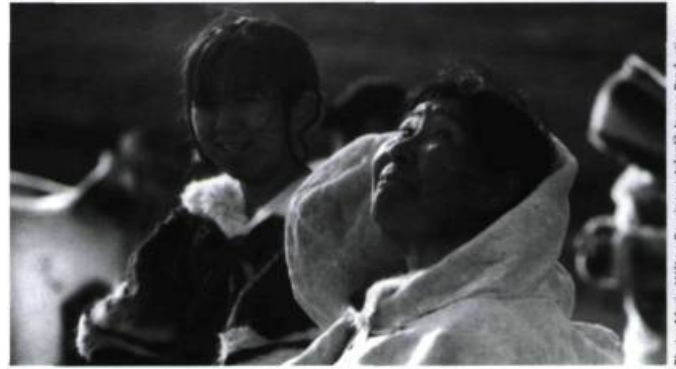
Atanarjuat, la légende de l'homme rapide (2001).