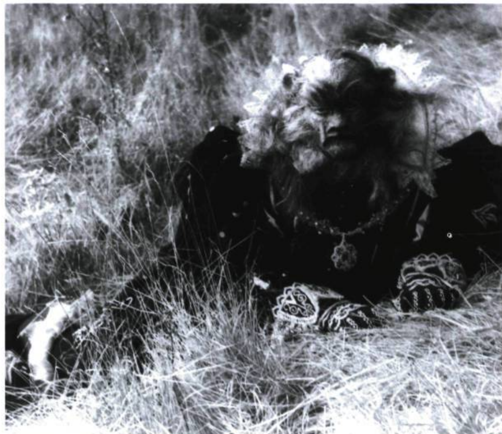
La belle et la bête (1946). Cocteau ou le cinéma comme expérience poétique proche du rêve.

Étant édités aux États-Unis, les DVD consacrés à Cocteau sont commercialisés sous leurs titres anglais. Les sous-titres anglais y sont optionnels.