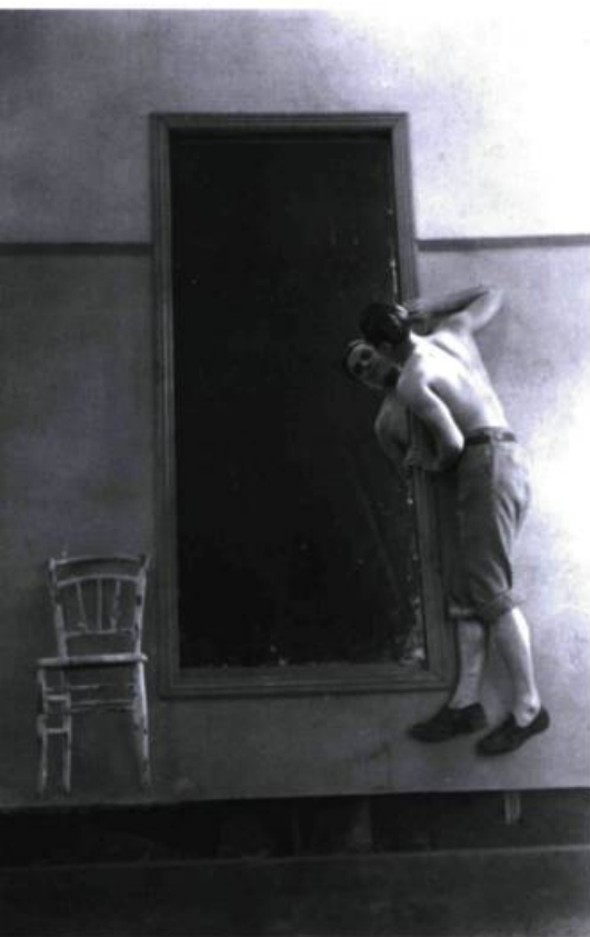
Le sang d'un poète (1930).

Premier film de Cocteau, Le sang d'un poète demeure un objet inclassable, rempli d'illuminations autant que de maladroites. Notons au passage qu'on y reconnaît la splendide Lee Miller, qui fut un temps la compagne et le modèle de Man Ray. Dans ce court métrage (55 minutes), Cocteau établit l'ensemble des paramètres de son œuvre cinématographique : le cinéma est pour lui un véhicule poétique, un moyen puissant – par le recours au merveilleux et le réalisme de l'image photographique – de faire vivre au spectateur une expérience poétique proche du rêve. Sur le plan thématique, le film est