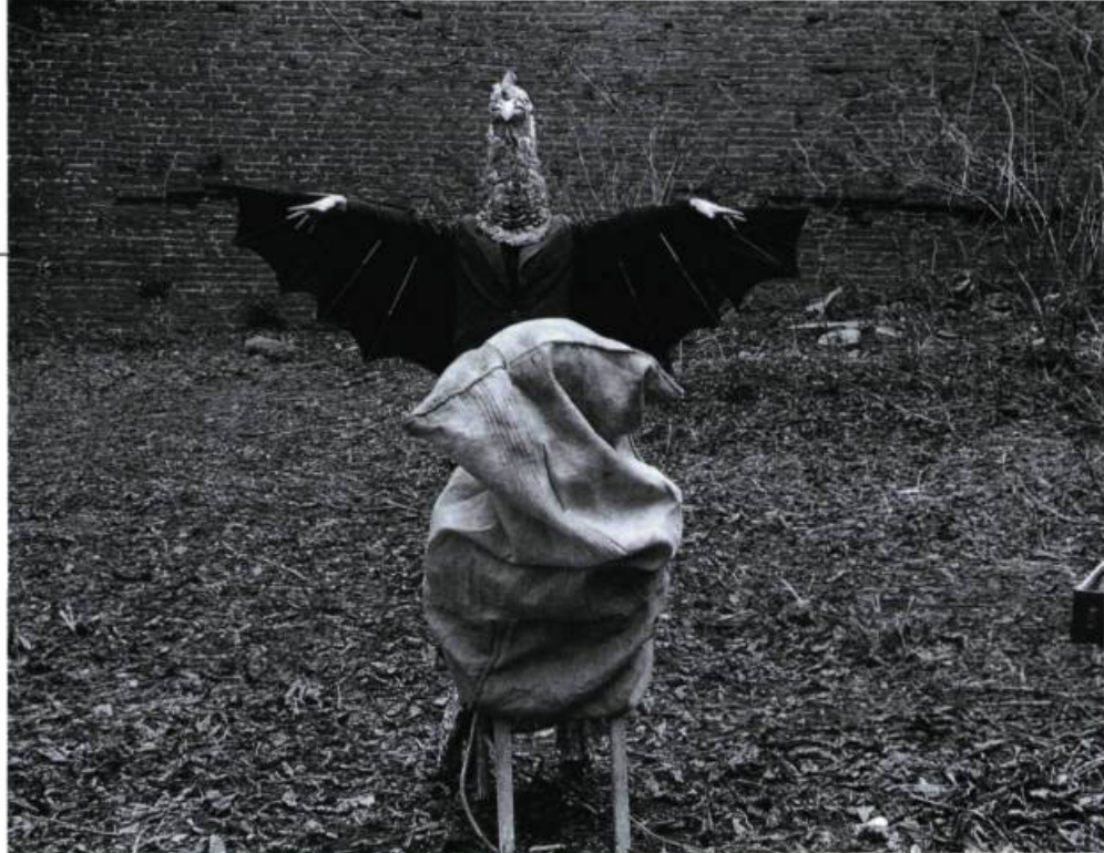
Un homme se transforme en coq pour affronter et vaincre la peur de sa voisine.