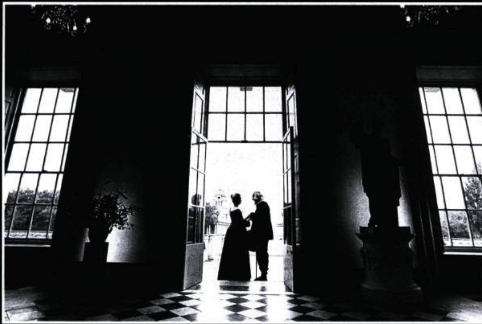
Artemisia d'Adrienne Clarkson

tion féminine», et on veut bien croire qu'elle avait un réel talent, qu'elle ait fait preuve d'audace au plan technique ou autrement, mais pour nous en convaincre il aurait fallu analyser en profondeur plus que deux ou trois des œuvres qui pourraient lui être attribuées.