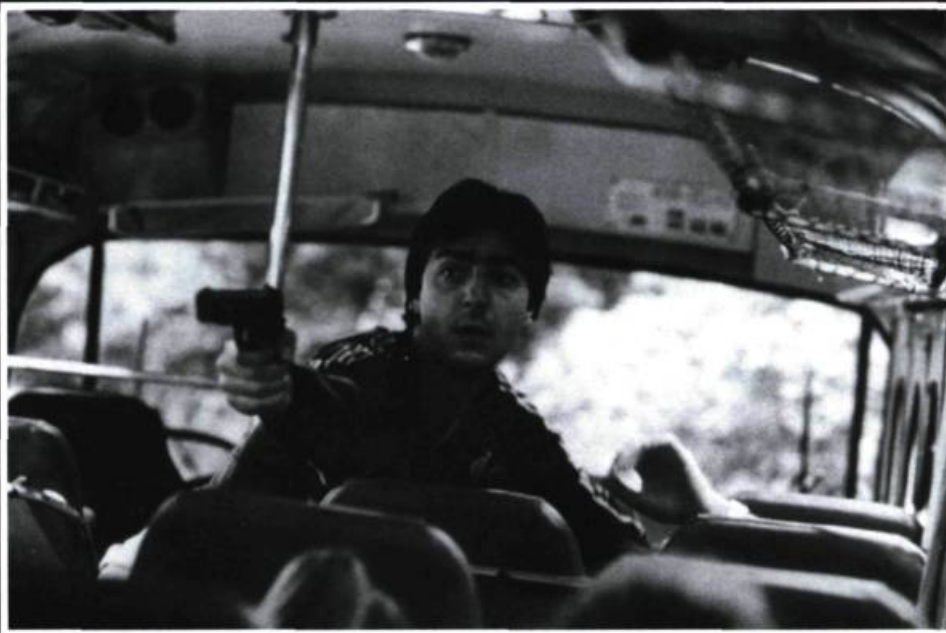
Yvan Attal dans Aux yeux du monde d'Éric Rochant

Ce qui n'est pas le cas d'Olivier Schatzky avec Fortune Express . Dès les premiers plans, on sent que le réalisateur avec ce premier film veut s'imposer et marquer chacun de ses plans,