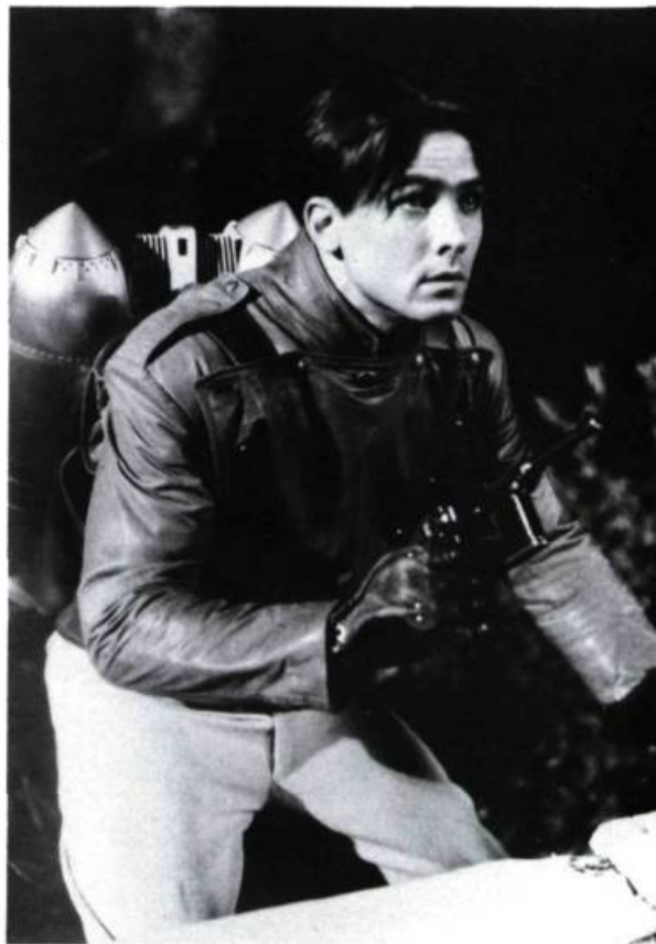
Bill Campbell, The Rocketeer

Rocketeer est un film bien ficelé. Le goût de Joe Johnston pour les machines improbables et les pastiches (le Hollywood des années 30, les films de propagande nazie) constitue l'un des aspects les plus amusants du film. En outre, Timothy Dalton y incarne avec talent un personnage à double facette, Neville Sinclair, star d'Hollywood en même temps que taube à la solde des Nazis. Cependant, ce qui gâche le plaisir innocent qu'on peut prendre au film, c'est sa tendance naïve au patriotisme red-neck exprimée à grands coups de répliques qui sonnent comme des slogans et d'images où le drapeau américain flotte en évidence. Lorsque Paul Sorvino, qui interprète le chef mafioso, se rend compte de l'intérêt des Nazis pour le réacteur, le réalisateur lui fait dire cette phrase que je cite de mémoire : «I may be a criminal but I'm a hundred per cent American.» Et le bougre de combattre les Allemands aux côtés du F.B.I. ! Quant au spectateur québécois, il ne se sent pas concerné. (É.-U. 1991. Ré. : Joe Johnston. Int. : Bill Campbell, Timothy Dalton, Jennifer Connelly, Paul Sorvino, Terry O'Quinn.) 108 min. Dist. : Touchstone. — M.D.