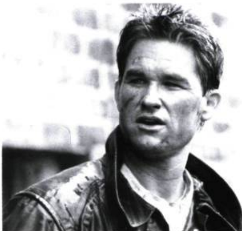
Kurt Russell, Backdraft