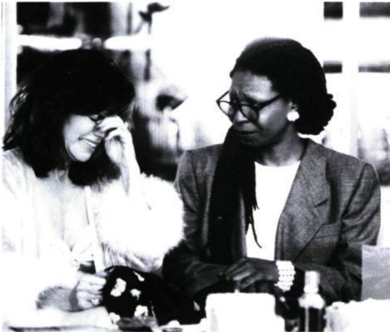
Sally Field et Whoopi Goldberg, Soapdish

succès intitulée The Sun Also Sets . De chaque côté de la caméra se multiplient donc les revirement mélodramatiques, les trahisons, les histoires d'orphelines retrouvées et les crises d'hystérie. Et, comme tout bon soap, le film comporte aussi un «very glamorous casting»: Sally Field, Kevin Kline, Robert Downey Jr., Cathy Moriarty, Whoopi Goldberg, Carrie Fisher et même Garry Marshall, le réalisateur de Pretty Woman .