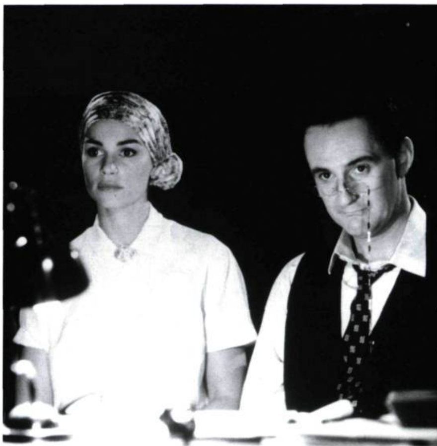
Valérie Kaprisky et Yves Jacques, Milena