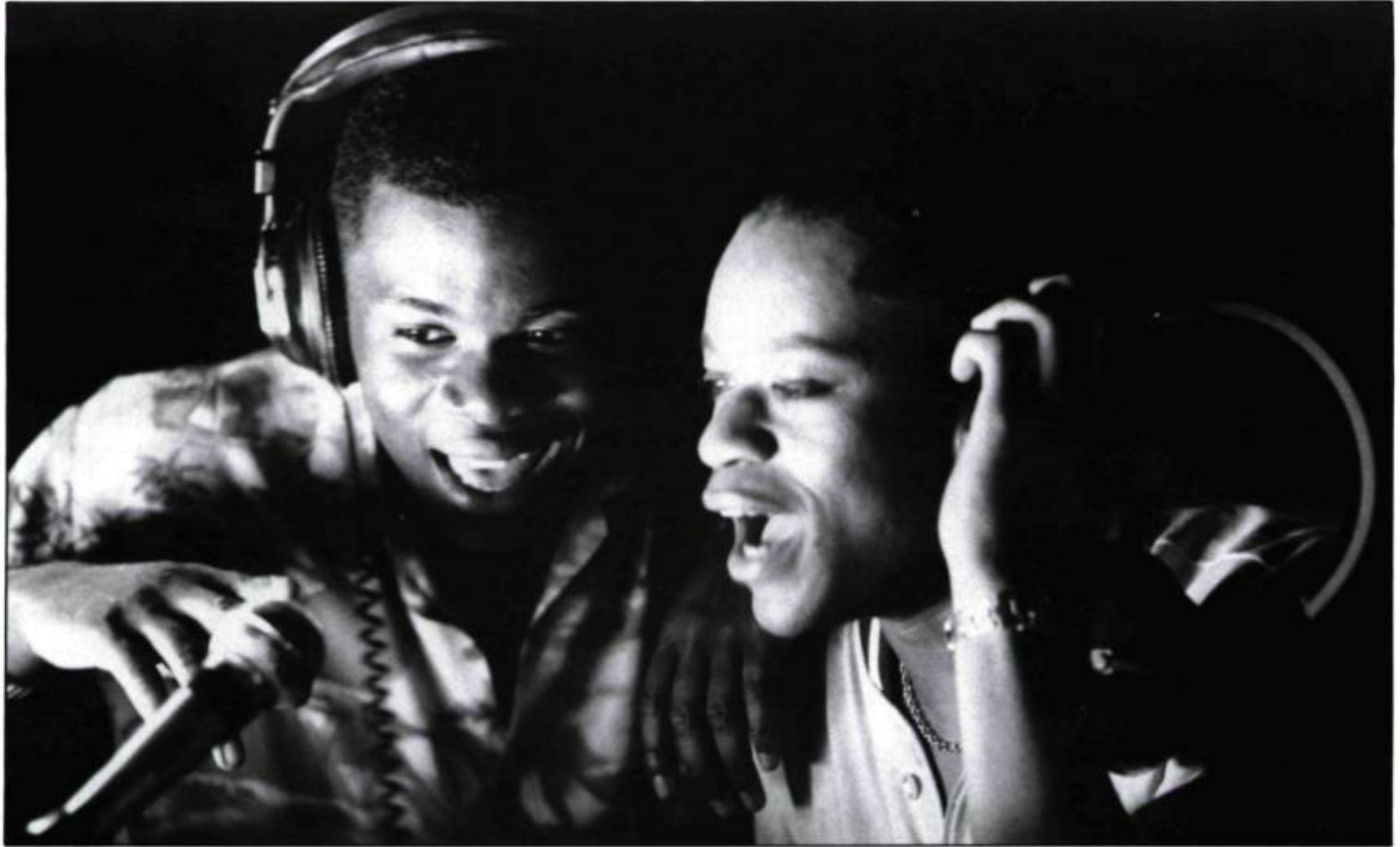
Young Soul Rebels de Isaac Julien.

à la mentalité des géoliers, pris à leur propre piège et à leur « folie » respective, qu'à celle de leur victime, un innocent jeune photographe français pris en otage pour assurer la libération d'un « cousin » emprisonné en France. À travers ses péripéties, il traduit bien le rapport ambigu des Libanais à l'Occident, et partant, « le rapport affectif et désespéré » de certains d'entre eux à la France. Point de manichéisme dans la description des personnages, ni de « message » gros comme le bras dans ce film efficace.