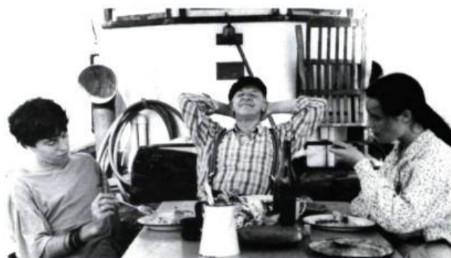
Festin sur l'Ange