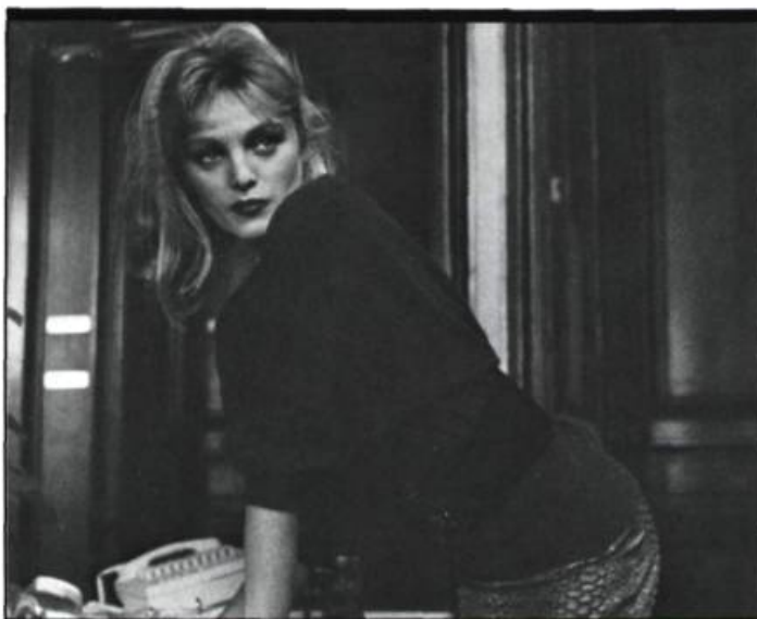
Arielle Dombasle dans La nuit porte jarretelle