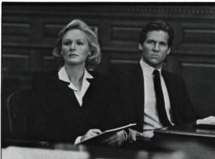
Glenn Close et Jeff Bridges dans Jagged Edge