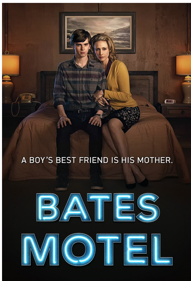
Fig. 1. Affiche de la saison 1 de Bates Motel , 2013.

9 12 Cependant, les vêtements de Norman et de Norma, leur voiture ainsi que leur goûts cinématographiques ( Double Indemnity , Wilder, 1944) et musicaux ( Mr. Sandman des Chordettes, 1958) renvoient à un temps suspendu. Conformément à la logique du reboot , la série est un pont entre le monde d'Hitchcock, ou de manière plus large l'époque classique du cinéma (qui est ainsi confirmée comme monde culte, que l'on peut citer), et le monde des nouvelles technologies.