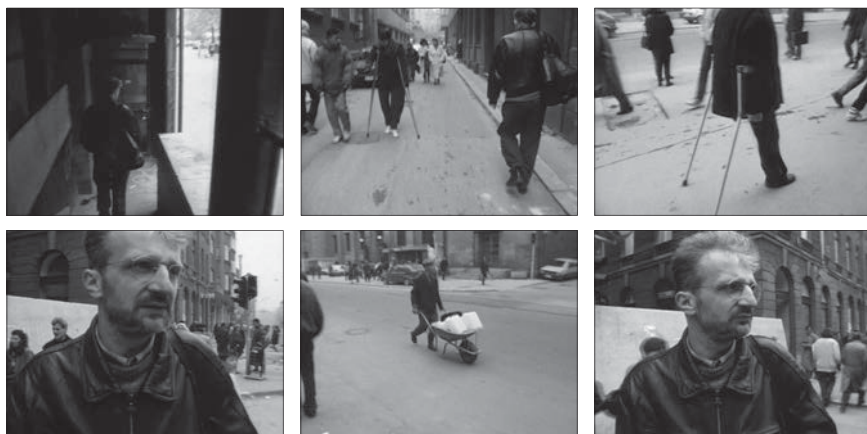
Fig. 10: Sarajevo Film Festival Film , 1994, 14 minutes. Édition intégrale, Johan van der Keuken, vol. 2, chez Arte France Développement, Ideale Audience International, Pieter van Huystee film, 2007.

Au tout début de Sarajevo Film Festival Film , on emboîte le pas à un inconnu, à travers des couloirs sombres. Arrivé dans la rue, l'inconnu s'arrête, la contemple en silence tandis qu'on – cinéaste, spectateur, passant – le dévisage. Mais une voix hors champ, la sienne, s'insinue et raconte le quotidien de la ville, la peur de la déambulation, la méfiance des uns envers les autres. Van der Keuken ose alors des allers-retours interrogatifs entre le personnage immobile au milieu de la rue qui paraît songer à la perte du commun, dont nous entretient sa voix en son hors champ, et les passants affairés, qui transportent eau et nourriture avec une diligence inquiète. L'arrêt du personnage, les allers-retours indécis de la caméra, et l'écoute de cette voix intérieure, font de ce moment de côtoiement et de partage de l'espace civil une sorte de miracle, tel que peut encore l'offrir le cinéma – comme pratique d'interaction tout autant que comme espace imaginaire de sociabilité 11 – à cette ville en guerre.