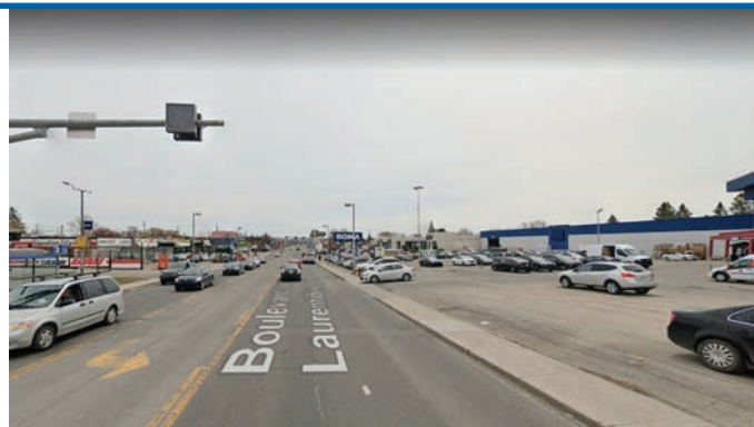
La route commerciale ou axe principal