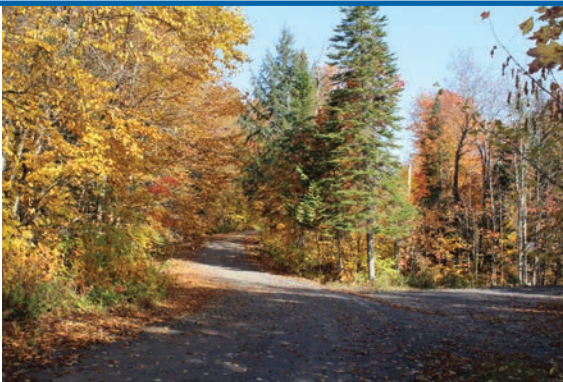
Le premier chemin