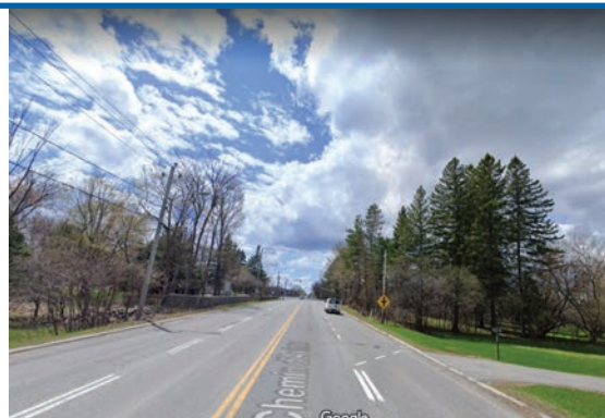
Le route élargie