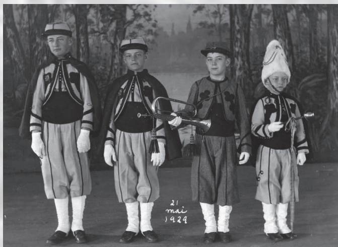
Petits zouaves.