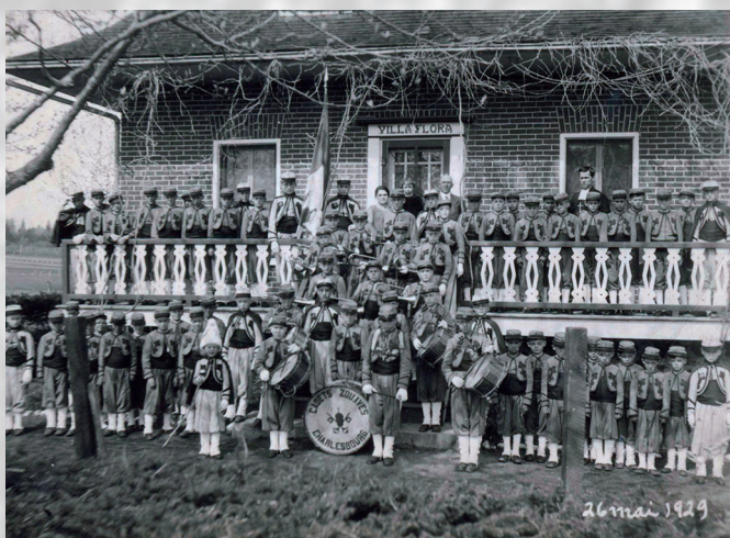
Devant la villa Flora.