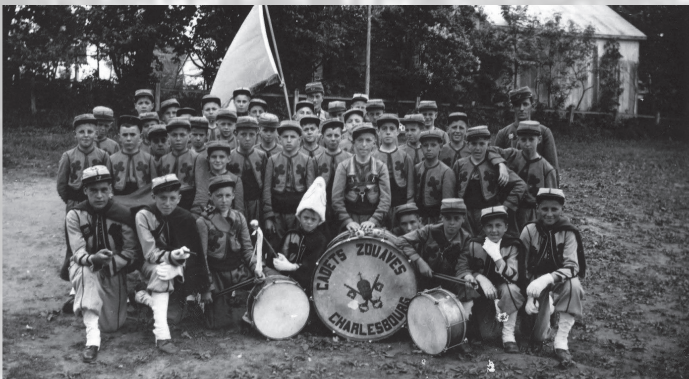
Petits zouaves.