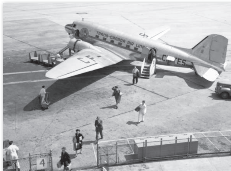
Un Douglas DC-3 de Trans-Canada Air Lines, Aéroport de Montréal (Dorval), juillet 1947, Musée de l'aviation et de l'espace du Canada, négatif 5573.

Pour demeurer compétitif, l'avionneur américain lance le Modèle 440 Metropolitan en 1956. Plus populaire à l'étranger qu'aux États-Unis, le Metropolitan est à ce point réussi que plusieurs transporteurs aériens l'utilisent jusqu'à l'introduction des premiers avions de ligne à réaction de taille moyenne, pendant les années 1960. Convair en produit environ 170, dont une vingtaine pour l'U.S. Air Force et l'U.S. Navy.