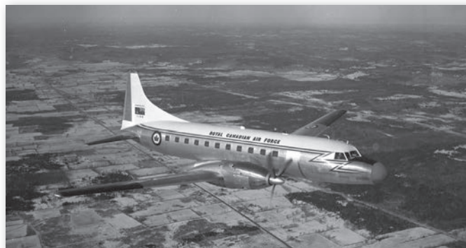
Un des Canadair CC-109 Cosmopolitan de l'Aviation royale du Canada, début des années 1960, Musée de l'aviation et de l'espace du Canada, négatif 25531.

Ainsi prend fin la triste histoire du Canadair CL-66 / Canadair 540. Lancé en grande pompe en 1958, ce programme de production s'effondre dès 1962. Tout comme par le passé, c'est grâce à la production d'avions de combat pour l'Aviation royale du Canada et des forces aériennes étrangères que Canadair se maintient à flot au cours des années 1960.