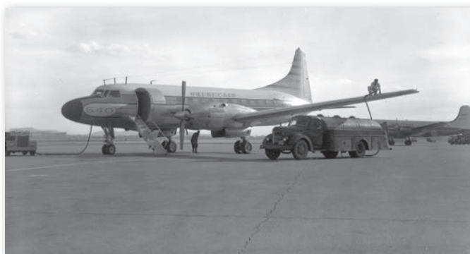
Un des Convair 540 convertis par Canadair et loués par Québecair, octobre 1960, Musée de l'aviation et de l'espace du Canada, négatif 25525.