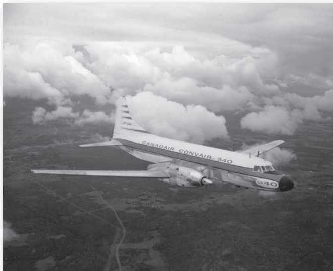
Un des Convair 540 convertis par Canadair, Musée de l'aviation et de l'espace du Canada, négatif 25505.

À l'automne 1958, D. Napier & Son lance une grosse campagne de promotion aux États-Unis, où se trouvent la moitié des Convairliners pouvant être convertis. Encouragée par l'intérêt suscité par l'Eland, D. Napier & Son fonde une filiale à Montréal en février 1959. Dépourvue d'usine au pays, D. Napier & Son (Canada) compte sur Canadian Pratt & Whitney Aircraft de Longueuil, l'actuelle Pratt & Whitney Canada, pour effectuer l'entretien des Eland. À plus long terme, la compagnie britannique songe à établir des ateliers d'entretien en sol américain.