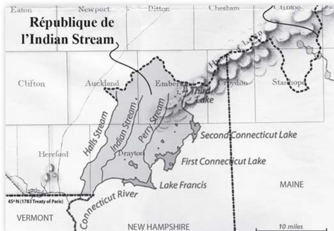
Carte de la république Indian Stream.