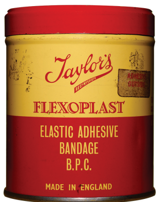
Boîte de pansement, date inconnue.

En 2007, le Centre universitaire de santé McGill (CUSM) se préparait à mettre en œuvre son projet de redéploiement selon deux objectifs. Dans un premier temps, il fallait intégrer trois hôpitaux universitaires, le Centre du cancer des Cèdres et l'institut de recherche dans un nouveau complexe hospitalier de fine pointe situé dans l'arrondissement Notre-Dame-de-Grâce, à Montréal. Par la suite, il s'agissait de réaliser la réfection de l'Hôpital de Lachine et de l'Hôpital général de Montréal. Dans ce contexte, le projet patrimonial du CUSM – devenu ensuite le Centre d'exposition RBC du CUSM – est né afin de préserver le patrimoine et la culture matérielle des hôpitaux du centre hospitalier lors des déménagements et des travaux de construction de ces établissements.