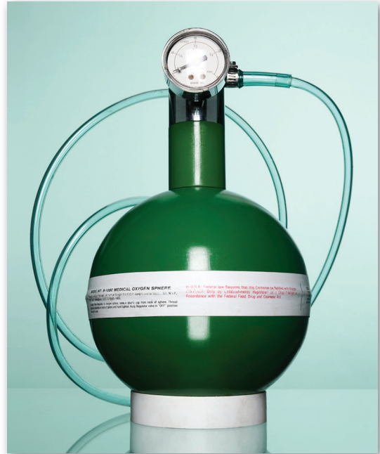
Réservoir d'oxygène, circa 1960.

sur la valeur de la collection que sur le rôle et la responsabilité du CUSM face à cette dernière ainsi que la meilleure façon de procéder afin de la protéger. D'une part, la collection valait-elle la peine d'être préservée et si oui, pourquoi était-il pertinent de laisser ces artéfacts au sein de leur institution d'origine plutôt que de les confier à un musée? Et si le CUSM prenait la décision de garder son patrimoine au sein de ses établissements, comment alors justifier qu'une institution dédiée aux soins de santé se dote également d'une collection et des responsabilités de sauvegarde et de diffusion du patrimoine?