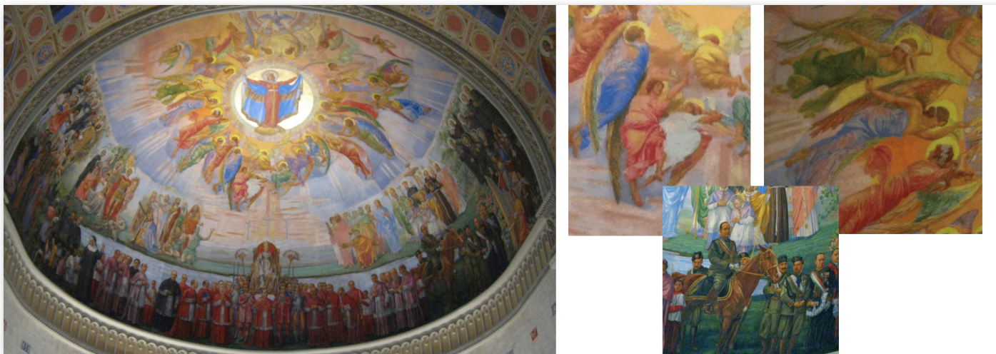
Fresque murale du chœur de l'église Notre-Dame-de-la-Défense (Montréal) et détails de celle-ci.