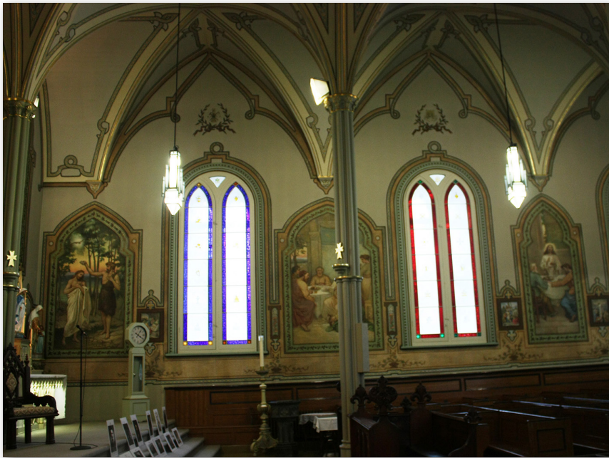
Vue du mur droit de la nef prise près du chœur, 2013, église de Saint-Hilaire.

ses œuvres. Dans le décor de l'église de Saint-Hilaire, Leduc s'assure de la cohésion de toutes les toiles entre elles et de leur clarté, tant en ce qui a trait à leur iconographie qu'à leurs caractéristiques formelles. De ce fait, il respecte les deux propriétés du beau, ainsi que l'unification de l'essence et de la matière telles que promues par le thomisme. Le message qu'il tente de transmettre à travers ses tableaux, l'union de l'âme au Divin, consiste en un idéal qui oriente également chacune de ses actions au quotidien et qui l'incite à laisser de côté les contraintes pour privilégier une appréhension globale de la nature. Une réflexion profonde et une grande sensibilité nourrissent sa quête et se dénotent dans son travail, qui constitue une véritable richesse de notre patrimoine culturel.