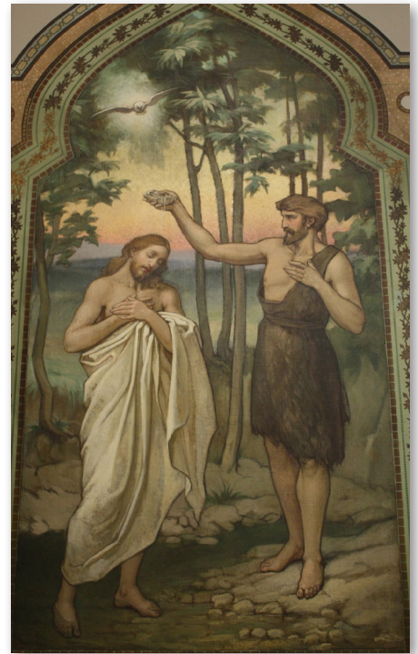
Ozias Leduc, Le Baptême du Christ, 1897-1900, huile sur toile, 304 X 147 cm, église de Saint-Hilaire