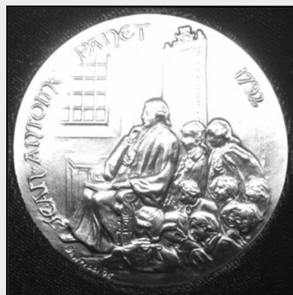
Médaille de l'Assemblée nationale

Sincères félicitations, Monsieur le président, nous sommes fiers de vous !