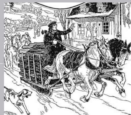
Le convoi de bois de chauffage, de Saint-Sauveur à Montréal, afin de venir en aide aux familles pauvres de la ville.

L'arrivée des chemins de fer a été un point tournant dans l'évolution des Laurentides. Ce moyen de transport constituait un débouché commercial pour les colons souhaitant vendre leurs produits; il leur permettait également de vaquer à leurs affaires sans être obligés d'y consacrer trop de temps et de fatigue. En somme, grâce aux chemins de fer, la vie des colons était transformée et ils pouvaient enfin se permettre de planifier et même de rêver à des jours meilleurs.