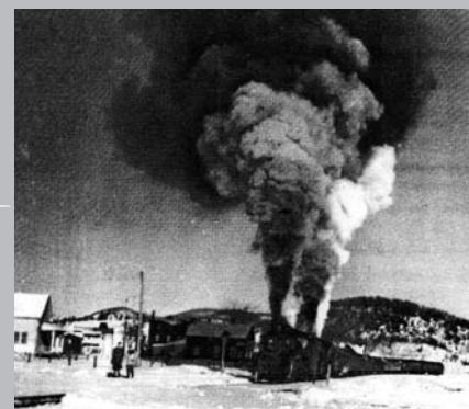
Le train Montréal-Lac Rémi. Court arrêt à Saint-Sauveur.