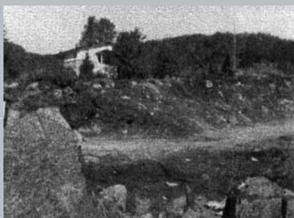
Exemple de la qualité des terres de la région de Sainte-Adèle.

Saint-Jérôme de 1848 à 1851 et porteront la mention « Mission Sainte-Adèle », car le curé Thibault est prudent et n'apporte pas les registres lors de ses déplacements entre le village et la mission, à cause de l'état lamentable des chemins à parcourir.