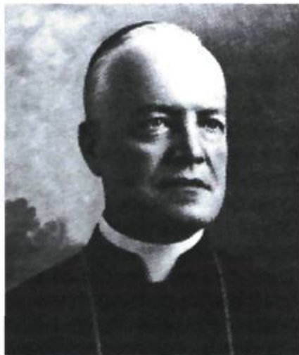
Monseigneur Joseph Charbonneau

À l'époque duplessiste, la religion catholique, pratiquée par 86% de la population, tient un rôle important dans la société québécoise, celui de transmetteur des valeurs collectives. Elle exerce aussi un certain contrôle social en imposant la censure. Son pouvoir est basé sur trois forces : la foi, qui impose l'adhésion et le respect, son rôle de «dispenseur de services» 3 [éducation, soins de santé, charité et culture, voir annexe 1] qui la rend indispensable, et son encadrement idéologique. Extérieurement, la foi se porte très bien. 4 Cependant, le «baby boom» qui suit la Deuxième Guerre mondiale demande une augmentation des services tels que l'éducation et la santé. L'Église est donc débordée au lendemain de la guerre et elle ne suffit plus à la tâche.