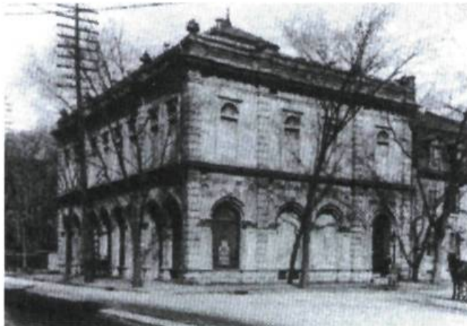
Édifice de la Art Association of Montréal.

qués]. On commence à la fin des années 1930 à donner des cours d'art dans certains collèges comme Brébeuf et Notre-Dame de Montréal. On fonde, en 1942, l'Institut des arts graphiques de Montréal. L'enseignement donné dans ces institutions est cependant déjà contesté dès les débuts de la Guerre. On le dit trop académique, dépassé et écrasé par les traditions. C'est dans cet esprit que Paul-Émile Borduas et Alfred Pellan amorceront une révolution culturelle. Pellan, par exemple, entre