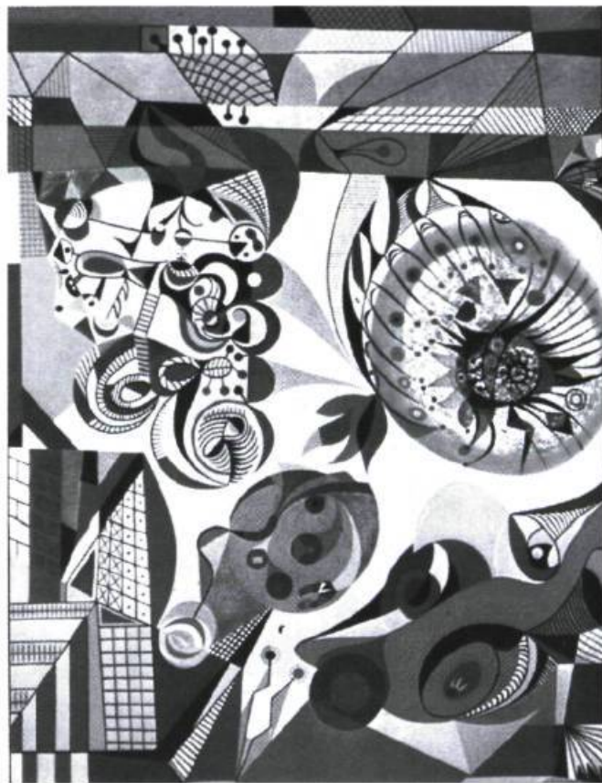
Alfred Pellan et quelques autres artistes prônent surtout la liberté d'expression dans la peinture et refusent toutes contraintes. Floraisons d'Alfred Pellan, 1952, Galeries nationales du Canada.

Sur le plan de la culture d'élite, on ne peut guère parler de Grande noirceur. Le Québec au contraire produit des œuvres de qualité; Montréal et un peu Québec sont en quelque sorte les points de mire de la peinture moderne. Nous ne sommes pas fermés aux influences extérieures. Ainsi, en 1948, deux manifestes, s'inscrivant sous la bannière des « automatistes », voient le jour : Prisme d'yeux en février, comptant Alfred Pellan et quelques autres artistes, prônant surtout la liberté d'expression dans la peinture et refusant toutes contraintes ; le Refus global en août, dans lequel Borduas, Riopelle, Ferron, Mousseau, «Dénonce[nt] le passéisme, l'obscurantisme et le conformisme artistique et moral de la société québécoise, attaque[nt] le clergé et le système d'enseignement et plaide[nt] en