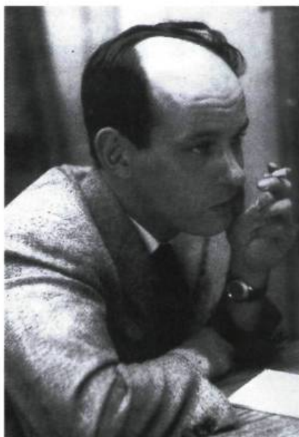
René Lévesque à l'époque où il était journaliste à Radio-Canada.

Depuis la Seconde Guerre mondiale, la diffusion des idées d'une certaine