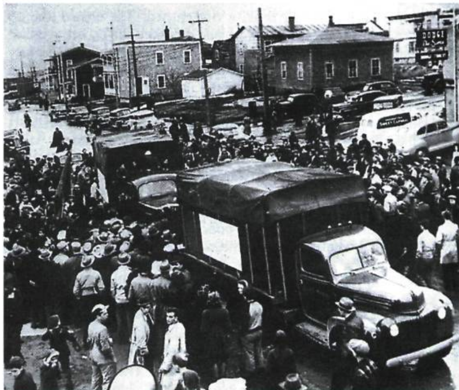
Des camions de nourriture sont acheminés aux grévistes d'Asbestos en 1949.

Sur le plan des luttes ouvrières, la vision des choses et les comportements