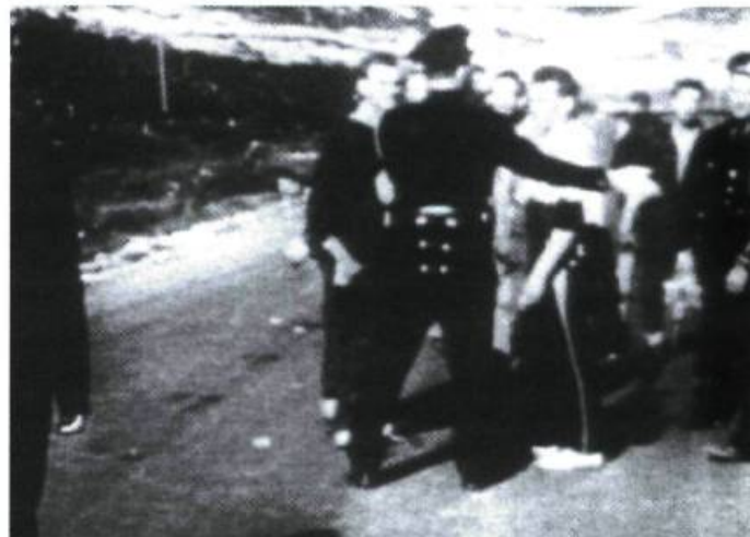
Le syndicalisme de masse était un des phénomènes déjà bien présents avant 1960 comme en témoigne entre autres, la grève des mineurs de Murdochville, en 1957.

Il s'agit de catégories identitaires grâce auxquelles les Québécois francophones se situent par rapport à eux-mêmes dans leur trajectoire historique et se situent aussi par rapport aux autres dans la trajectoire universelle. 7