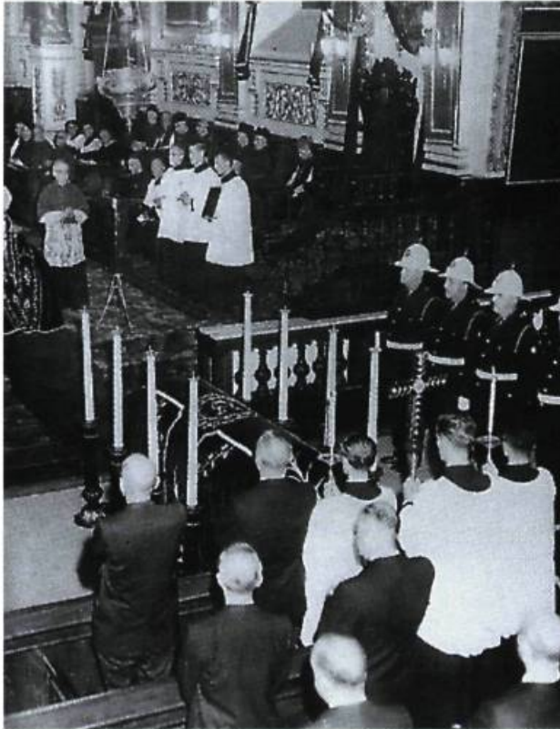
Duplessis meurt le 3 septembre 1959, à Shefferville. Dès la mort du « Chef » et la ruine de son parti, prompts seront les historiens, politologues et les journalistes à tirer un trait sur le passé.