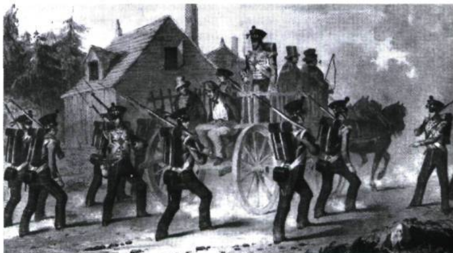
Des soldats anglais escortent des insurgés vers la prison de Montréal. (Dessin de M. A. Hayes gravé par J. H. Lynch)

Je m'attacherai ici à démontrer comment l'iniquité de ces procès a contribué à faire des Patriotes les martyrs et les héros des Québécois francophones. Ce sera une démonstration en deux parties : la première se voudra une mise en lumière des iniquités perpétrées sous l'égide de la Loi martiale en 1839 et qui ont valu aux condamnés la sympathie de la population. Les emprisonnements, la composition du Tribunal militaire et le déroulement des procès y seront successivement abordés. La seconde partie de ce travail s'attachera à démontrer que les condamnés de 1839 sont bel et bien demeurés des martyrs dans la mémoire collective du Québec, et ce jusqu'à nos jours. Cette partie se subdivisera en cinq points d'analyse, soit (1) l'historiographie canadienne-française, (2) les