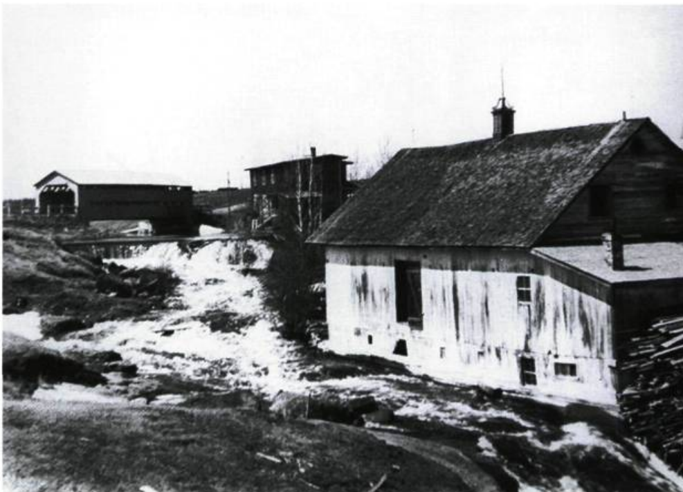
Moulin des Laurendeau bâti en 1902 fin des opérations en 1959

Le dimanche était strictement respecté. On récitait le chapelet l'avant-midi et l'après-midi c'était le lavage du linge; les conditions d'hygiène étaient bien élémentaires. Dans nos temps libres on jouait