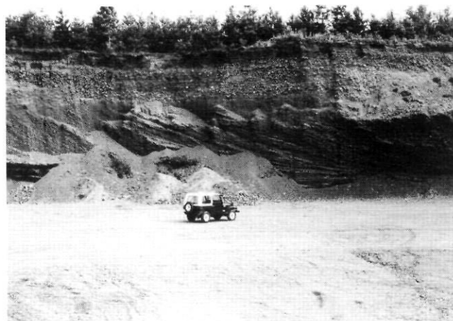
FIGURE 3. Delta juxtaglaciaire de Beebe associé à la phase III et montrant des structures deltaïques complètes.

Une date minimale pour la phase III (UQ 129: 14 860 \pm 160 BP; non corrigée) est obtenue sur une concrétion près de Beebe, dans une importante coupe le long de la rivière Tomifobia (BOISSONNAULT et al. , 1981). Cet échantillon de sable graveleux cimenté par la calcite provient de sédiments fluviolacustres localisés sous une couche de till recouverte par des sédiments prodeltaïques de la phase III. La présence de ces concrétions dans le delta de Stanstead indique que l'ensemble de la coupe est inondé lors de la phase III. En conséquence, cette date fournit l'âge minimal de cette phase et, indirectement, l'âge approximatif du début de la déglaciation dans le sud du Québec. Cette date concorde assez bien avec celle obtenue par GADD et al. (1972) au fond du Unknown Pond, tout près de la frontière Québec-Maine (GSC-1339: 14 900 \pm 200 BP).