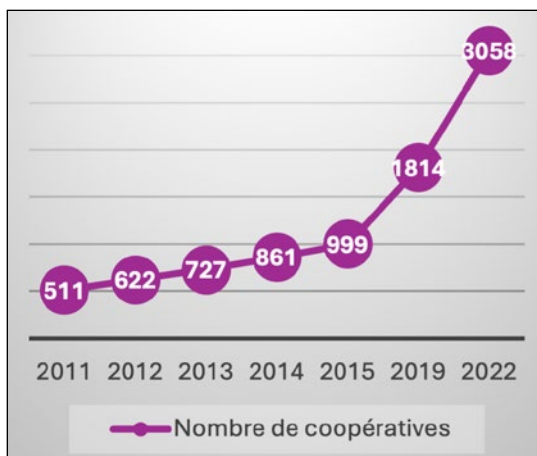
Figure 1. Évolution du nombre de coopératives dans la région DT depuis 2011