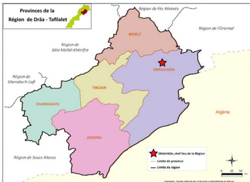
Carte 1. La région Drâa-Tafilalet (HCP, 2014)

Sur le plan géographique, la région a des limites administratives avec les régions de Fès-Meknès et la région de Béni Mellal-Khénifra au Nord; la région de l'Oriental à l'Est; les régions de Marrakech-Safi et la région de Souss-Massa à l'Ouest; et l'Algérie à l'Est et au