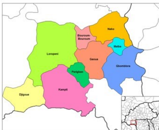
Figure 1 : Situation de la commune de Gbomblora