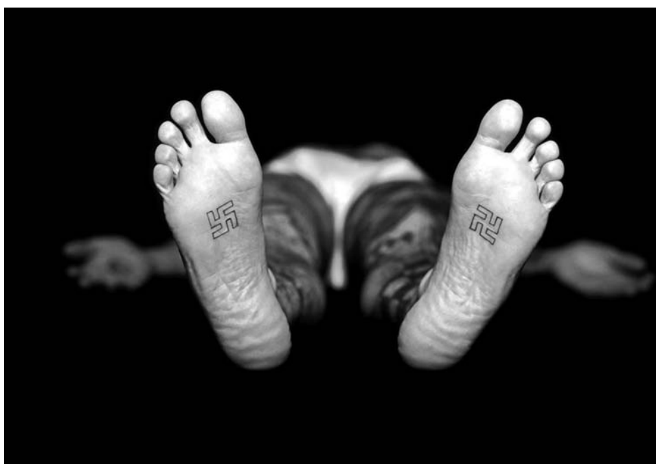
Lee Wagstaff, Lamb , 2000, C-print, 153 x 188 cm.

La photographe et vidéaste britannique recycle le thème chrétien pour l'installer dans un cadre profane : le modèle ne porte