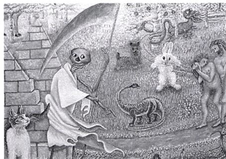
Adam et Ève chassés du Paradis Terrestre

«Je m'arrange avec Dieu», confiait-elle joyeusement à Josée Blanchette qui lui demandait si elle «pratiquait» sa religion 36 . J'ai rarement rencontré autant de santé dans les rapports à la vie, à soi, à la Peur et aux Dieux.