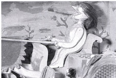
La charrette de la mort