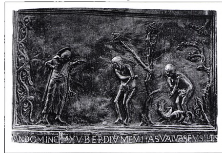
Adam and Eve Reproached by the Lord, 1015, portes de bronze, St.-Michael's Church, Cathedral Hildesheim, Allemagne

En bref, le prototype du plus fondamental mécanisme d'évitement de la Peur et d'évitement de Soi, par personnes interposées, impliquant autant les Dieux que les humains, le règne végétal et animal, est là, gravé dans le bronze, comme il se doit sur les portes d'une cathédrale, lieu privilégié des questions fondamentales sans réponses.