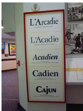
Centre culturel acadien de Lafayette, 2010.