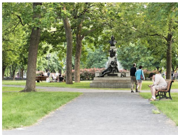
Photo I. Louis-Philippe Hébert, Monument à Louis-Octave Crémazie (1906). Collection d'art public de la Ville de Montréal.