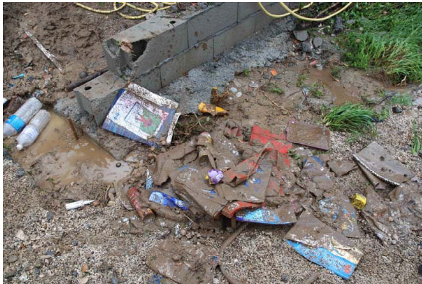
Fig. 2 – Des effets personnels « pêle-mêle » suite à l'inondation du Neez (Anne Tricot, mai 2007)