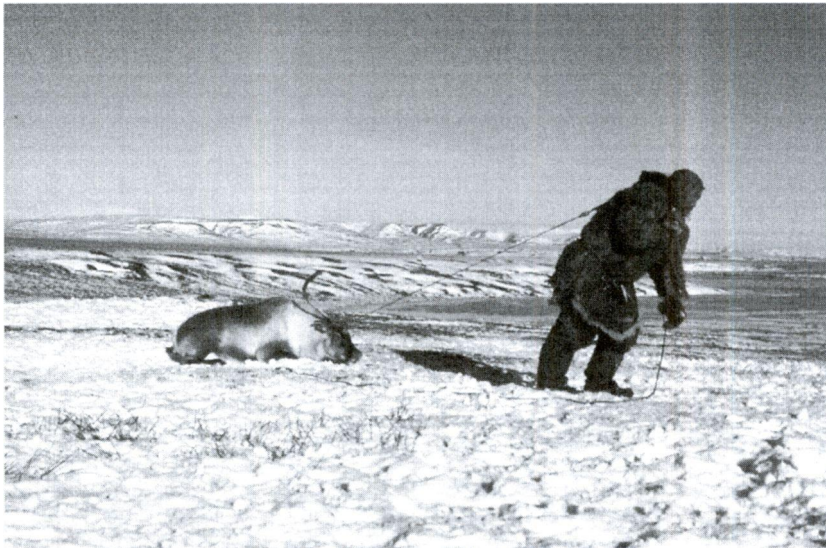
Figure 2. Première étape du dressage d'un renne destiné à être attelé (Amgouema, octobre 1997).

Même si cette remarque peut de prime abord paraître triviale, c'est également en étant en interaction avec leurs rennes que les éleveurs conservent une certaine maîtrise de leur troupeau. De cette façon, l'utilisation de l'attelage des rennes pour les divers déplacements ne constitue pas seulement le moyen de transport le plus économique et le plus écologique qui soit mais représente aussi d'une certaine manière une technique d'élevage 13 . Car, atteler implique plusieurs types de relations qui maintiennent tout au moins un certain degré de familiarisation.